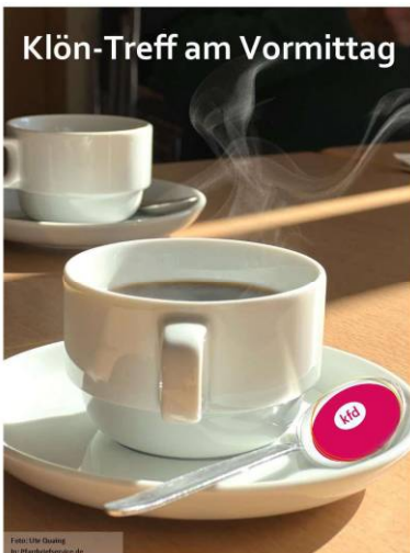
Klön-Treff am Vormittag

Karsamstag, 4.4.26 6 Uhr St. Lambertus Kalkum Meditativer Morgengang im Kalkumer Schlosspark